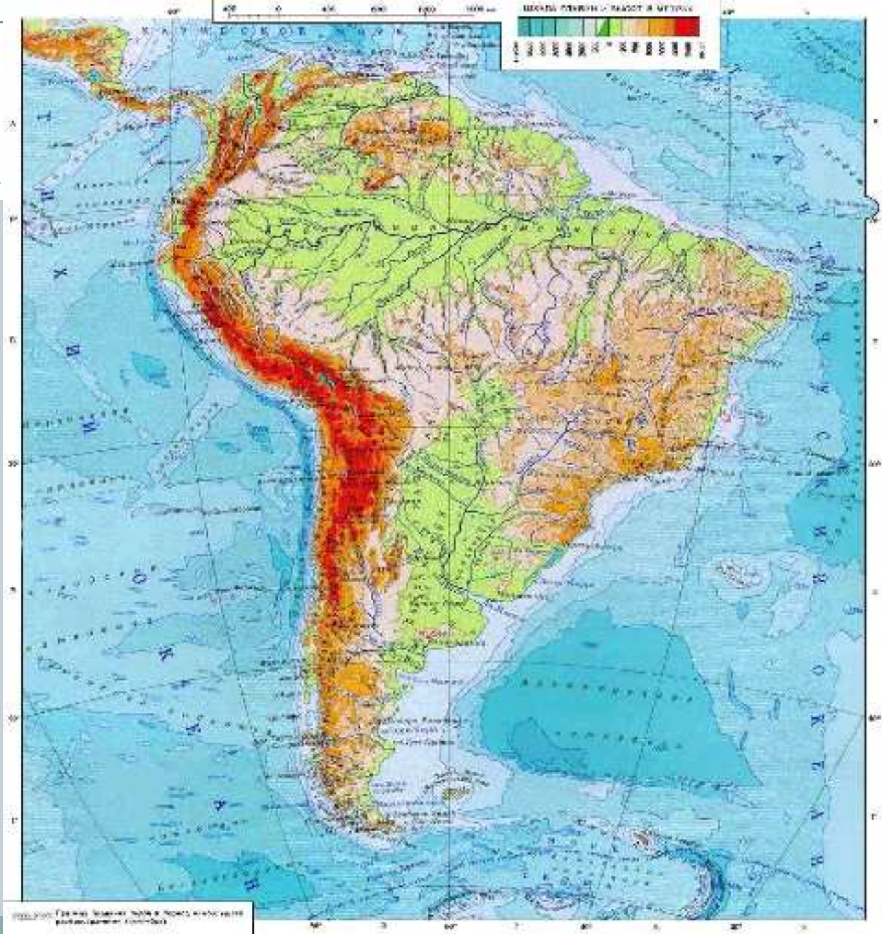
1:1000 000. Физическая карта Кавказа и сопредельных территорий.